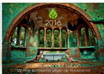
Das Deckblatt des Charity-Kalenders 2016: Wasser spendet... mehr