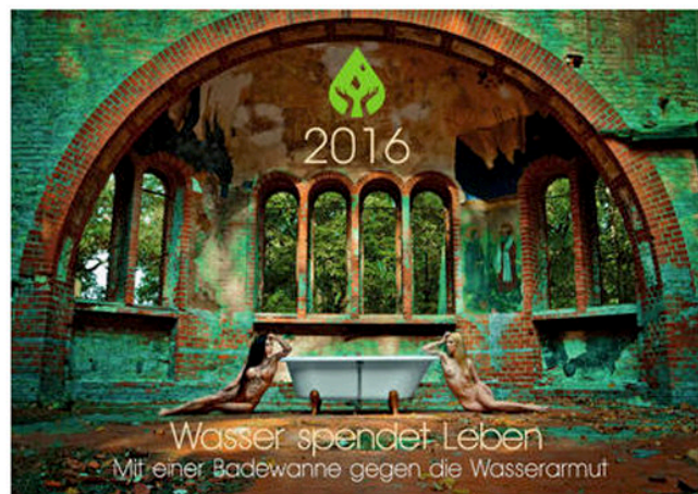
Das Deckblatt des Charity-Kalenders 2016: Wasser spendet Leben - Mit einer Badewanne gegen die Wasserarmut.

Der neue Kunst-Kalender 2016 zeigt 13 besondere Motive, für die eine Badewanne jeweils an einem besonderen Ort aufgestellt wurde. Für die Shootings reiste das Projekt-Team im Herbst 2015 für 4 Tage nach Berlin. „Lost (places) in Berlin“ lautet der Titel für den Kalender. „Verlassen und vergessen“ – dies trifft nicht nur auf die außergewöhnlichen Shooting-Locations zu, sondern auch auf die Menschen in Afrika, die mit dem Erlös aus dem Verkauf dieses Kalenders unterstützt werden sollen.