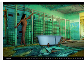
Feminine Ästhetik wird auch im Juni deutlich in Szene... mehr